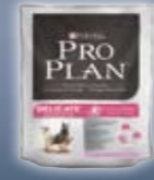
DELICATE Truthahn & Reis