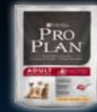
ADULT Huhn & Reis