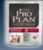
ADULT Ente & Reis