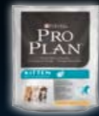
KITTEN Huhn & Reis