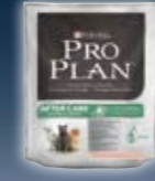
AFTER CARE Lachs & Thunfisch