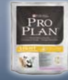
LIGHT Truthahn & Reis

Wenn Sie eine Packung PRO PLAN® mit nach Hause nehmen, können Sie sicher sein, dass das Produkt auf einer der weltbesten Forschungen basiert und nur aus hochwertigen Zutaten hergestellt wurde. Alle unsere Heimtierahrungsprodukte werden in den Purina PetCare Zentren umfassend getestet.