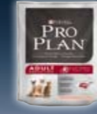
ADULT Lachs & Reis