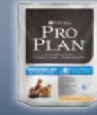
HOUSECAT Huhn & Reis