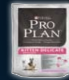
KITTEN DELICATE Truthahn & Reis

LASSEN SIE SICH VON DER PRO PLAN® PRODUKTPALETTE ÜBERZEUGEN.